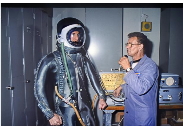
Im Druckanzug und klimatisierten Helm in die Stratosphäre.