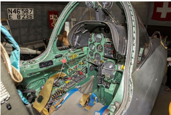
Blick ins Cockpit des Mirage III RS.