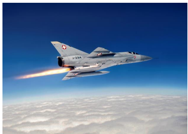
Das Raketentriebwerk ist gezündet.