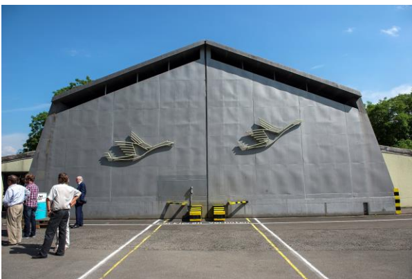
Das Bremshaus. Sitz des Mirage-Vereins