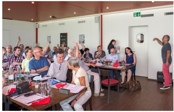
Den ganzen Abend stets Einstimmigkeit!