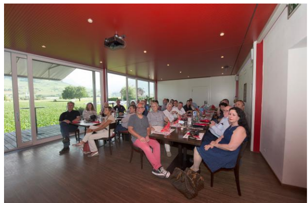
Wunderschöne Location und grosse Gastfreundschaft: Restaurant Nidair auf dem Flugfeld.