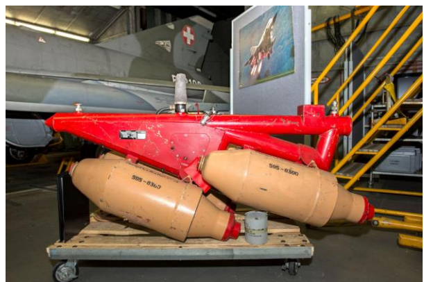
Der Jato-Kurzstart mit Raketen war etwas vom Spektakulärsten.