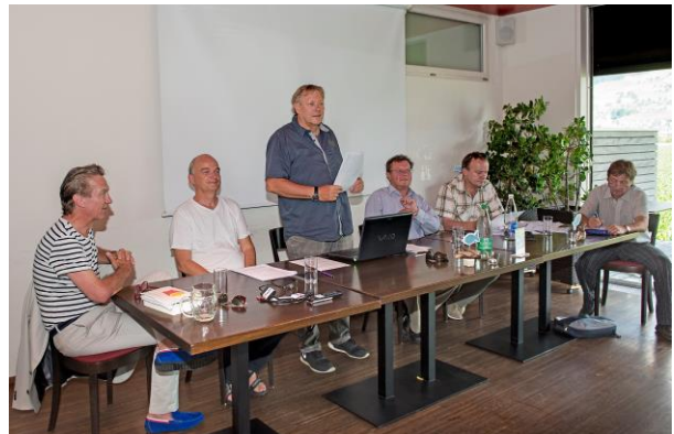
SAJ-Präsident Hansjörg Egger bei der Präsentation eines Mirage-Raketentriebwerk-Einsatzes.