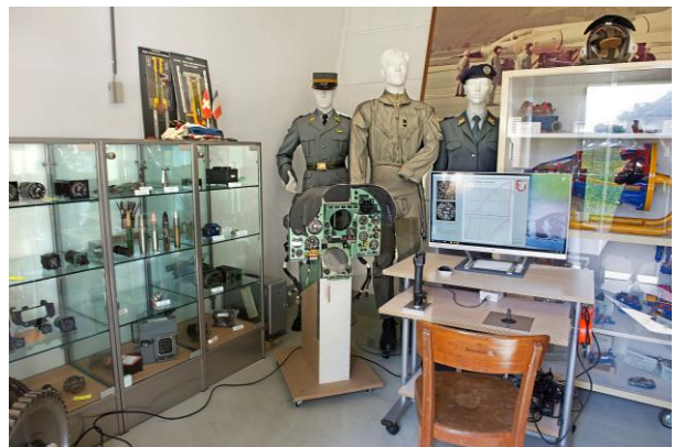
Blick in die Ausstellung im Bremshaus in Buochs.